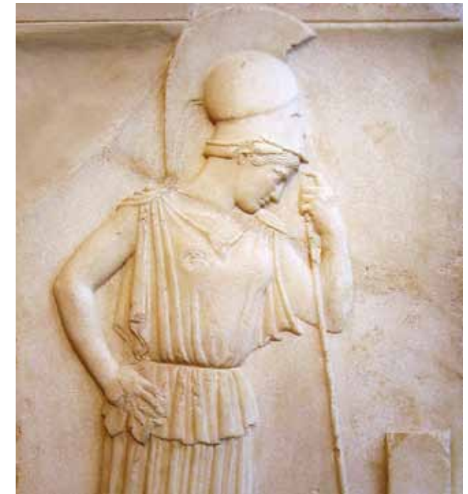
Fotografía: Atenea Pensativa (relieve). Museo de la Acrópolis, Grecia.